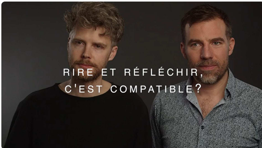
Le poids des fourmis - Rire et réfléchir, est-ce compatible?

> Enfin, regarde cette vidéo dans laquelle l'auteur, David Paquet, revient sur ce questionnement.