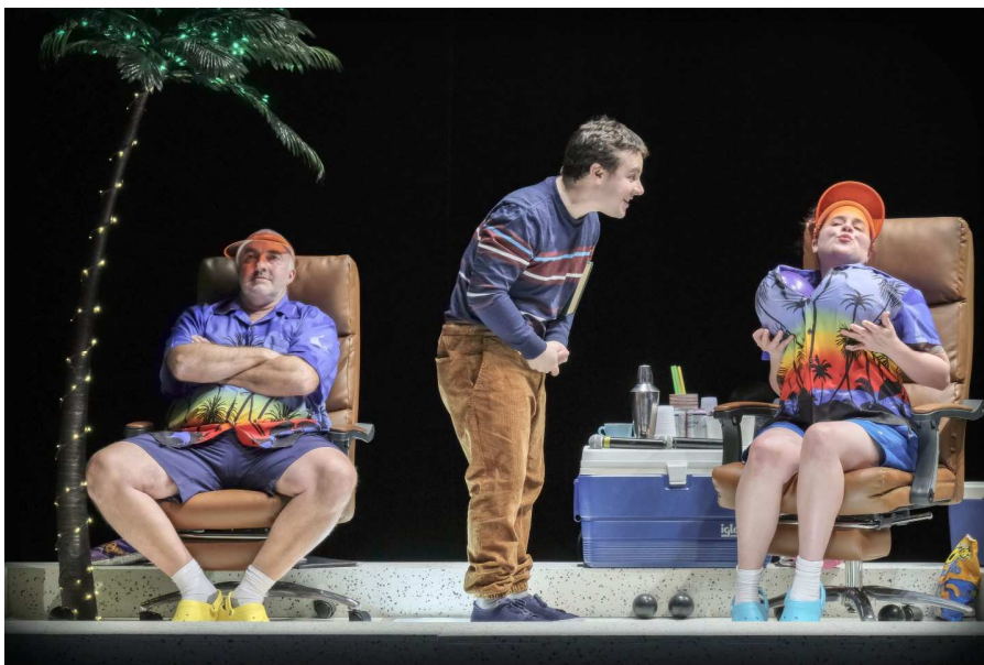
LE POIDS DES FOURMIS _ THÉÂTRE BLUFF _ NOVEMBRE 2019