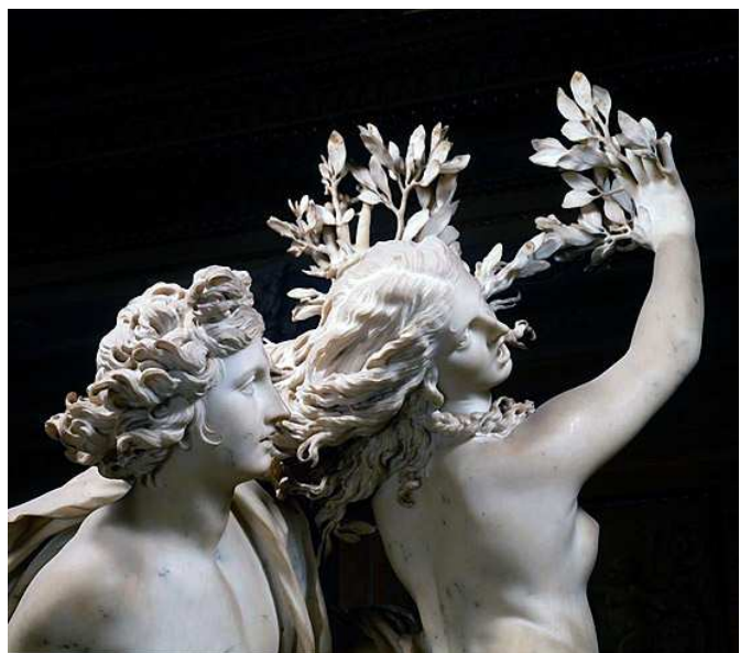
Apollon et Daphné, Le Bernin, Villa Borghèse